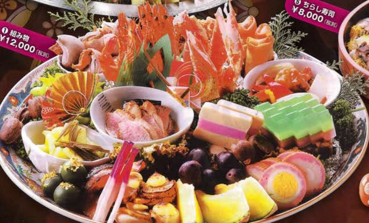
① 組み物 ¥12,000 (税別)