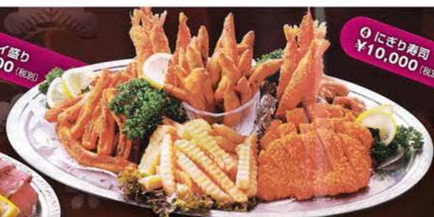
⑥ フライ盛り ¥8,000 (税別)