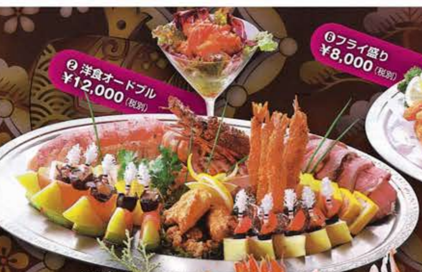
② 洋食オードブル ¥12,000 (税別)