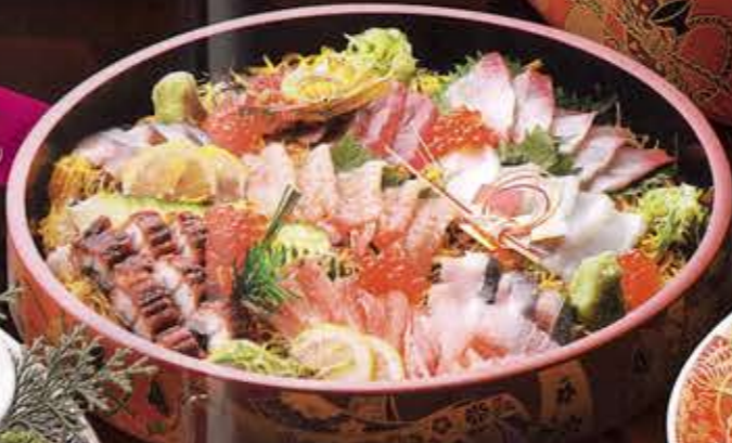
④ ちらし寿司 ¥8,000 (税別)