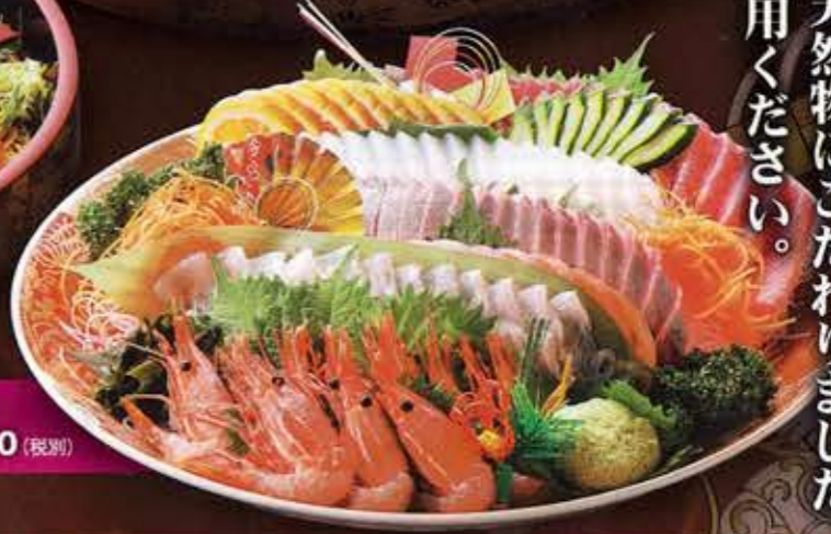
③ お造り ¥12,000 (税別)