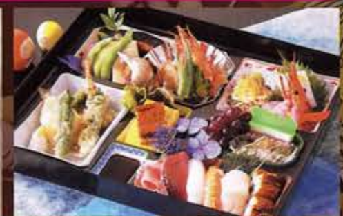
⑯ お弁当 ¥3,000 (税別)