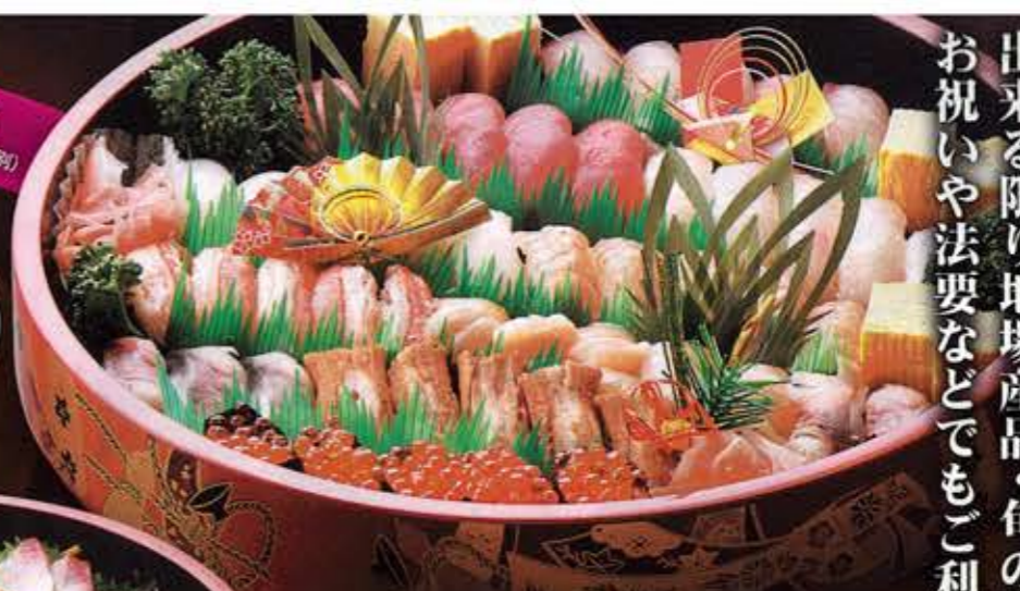
① にぎり寿司 ¥10,000 (税別)

出来る限り地場産品・旬の天然物にこだわりました。 お祝いや法要などでもご利用ください。